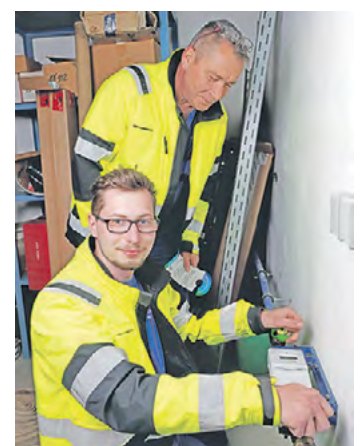
Den turnusmäßigen Zählertausch beherrschen beide engagierten Rohrleger aus dem Effeff.