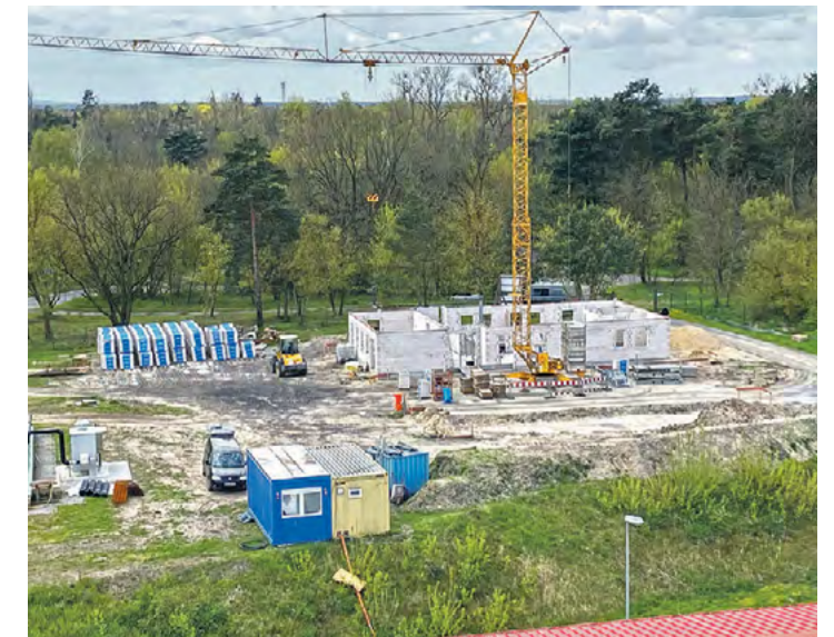
Jetzt sind die zukünftigen Arbeits- und Pausenräume der Abwasserexperten schon erkennbar.

triebsgebäude mit WCs, Duschen, Pausenraum, Leitwarte, Labor, Büros, Serverraum, Werkstatt und Umkleieräumen ausgestattet (Die Märkische WASSER ZEITUNG berichtete bereits). Von hier aus wird unter anderem die Tandemkläranlage Zossen betreut, die mittlerweile eine Größe von 49.666 Einwohnerwerten hat. Dies ist aufgrund der rasanten Bevölkerungsentwicklung am südlichen Rand Berlins notwendig. Noch im Februar 2005 lag ihre Kapazität bei 9.999 Einwohnerwerten.