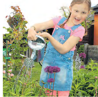
Fine gießt am liebsten mit aufgefanganem Regenwasser.