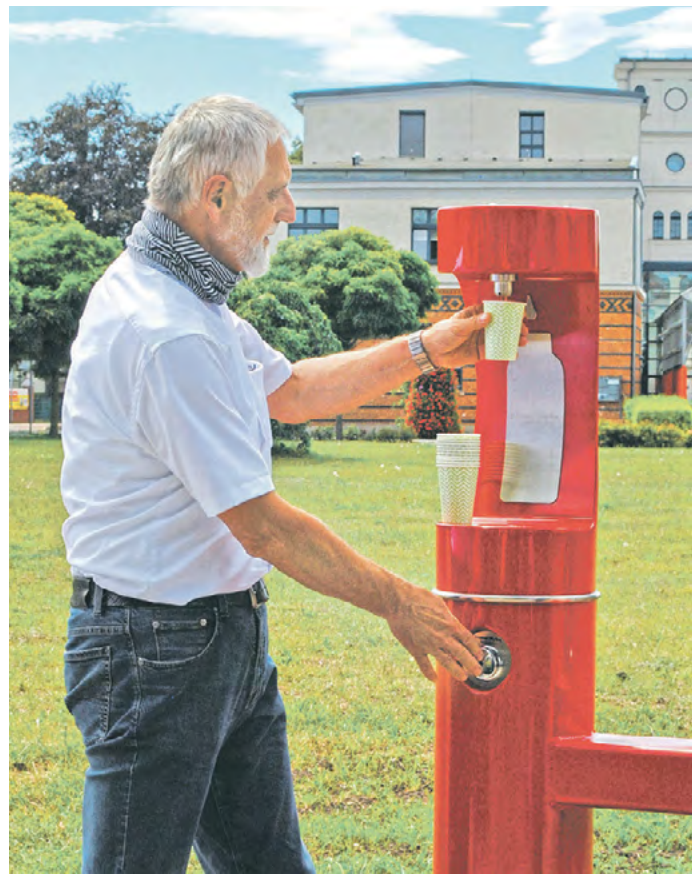
Am Gubener Dreieck können bereits seit Juli 2020 Mensch und sogar Hund ihren Durst stillen!

Dass Trinkwasser rund um die Uhr zuverlässig aus dem heimischen Hahn fließt – eine Selbstverständlichkeit. Nun wünscht sich der Gesetzgeber aber auch in Parks, Fußgängerzonen oder an touristischen Hotspots noch mehr (kostenlosen!) Zugang zum Lebensmittel Nr. 1. So soll Plastikmüll durch abgefülltes Wasser vermieden und am Ende CO 2 -Ausstoß gesenkt werden. Eine Nachfrage der WASSER ZEITUNG in den Rathäusern unseres Verbreitungsgebietes zeigt ein eher verhaltenes Echo, was neue Wasserspender oder Brunnen angeht.