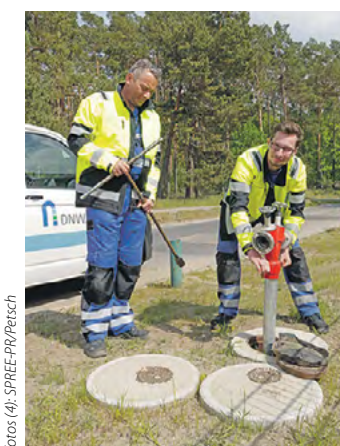
Zum Arbeitsinhalt gehören auch das Prüfen von Armaturen und das Anschließen von Standrohren.