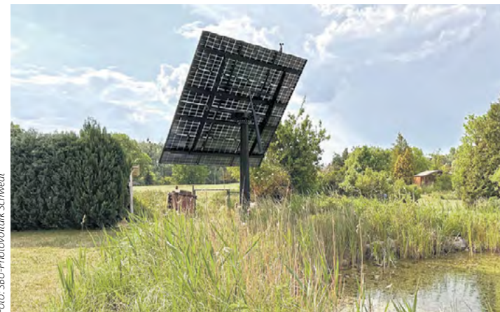
Im Wasserwerk Bad Saarow wird eine solche sonnenstandgeführte Anlage gebaut. Sie dreht sich automatisch der Sonne zu.