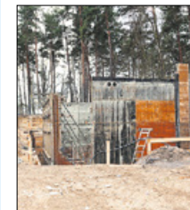
Mit Investitionen von 980.000 Euro wird in diesem Jahr die Kläranlage Crinitz erneuert, um künftig unter sehr schwierigen Vorflutverhältnissen die Abwasserentsorgung in Crinitz sicherzustellen.

gengrassau und Waltersdorf erneuert werden, damit künftig die Versorgung durch das Wasserwerk Schollen erfolgen kann. Investitionsschwerpunkt im Abwasserbereich ist einmal mehr die Kläranlage Kasel-Gölzig. „Der erste Bauabschnitt konnte 2013 wie geplant abgeschlossen werden“, so Ladewig. „Der zweite Abschnitt läuft bereits und der dritte ist in Planung.“ Insgesamt werden dabei bis 2015 rund 5 Mio. Euro investiert. Fortgeführt wird das Investitionsprogramm des TAZV Crinitz und Umgebung, der zum Jahresbeginn als neues Mitglied beim TAZV Luckau begrüßt wurde. Schwerpunkt wird hier im Abwasserbereich die Sanierung der Kläranlage Crinitz und im Trinkwasserbereich die Erneuerung der Trinkwasserleitung in der Hauptstraße Crinitz sein.