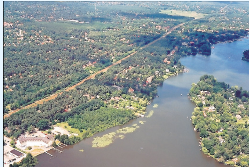
„Voll kanalisiert bis 2003“ – so titelte die MWZ in ihrer Juni-Ausgabe 1998 über das Abwasserprojekt ZEWS. Durch das in Ostdeutschland einmalige Vorhaben kamen in relativ kurzer Zeit entlang der S-Bahn-Trasse am Zeuthener See knapp 10.000 Grundstücke an den Kanal.