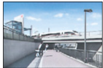
So soll sie Anfang des kommenden Jahres aussehen – die Unterführung. Lange Wartezeiten gehören dann der Vergangenheit an.

gewählt. Eine weitere Entscheidung mit Blick auf die Zukunft hat der Tagesordnung der kommunalen Vertreter, nämlich die über das Strategiekonzept. Seit Ende Januar liegt der Abschlussbericht vor. Hinsichtlich des Personalbestands wird festgestellt, dass er den zu lösenden Aufgaben adäquat ist. Organisatorisch bedeutsam ist der Strategievorschlag, dass die Trebbiner Ortsteile Blankensee, Glau, Klein Schulzendorf, Kliestow, Lüdersdorf, Schönhagen, Stangenhagen und Wiesenhausen zum 1. Januar 2015 in den Nachbarverband WARL Ludwigsfelde wechseln sollten. Dieser Neuzuordnung hat die Stadt Trebbin bereits zugestimmt. Der KMS hat auf seiner Sitzung hierzu beschlossen, Verhandlungen über den Austritt von Trebbin aufzunehmen und eine Auseinandersetzungvereinbarung zu erstellen. Im „Alltagsbetrieb“ des Verbandes ist aus technischer Sicht unbestreitbar