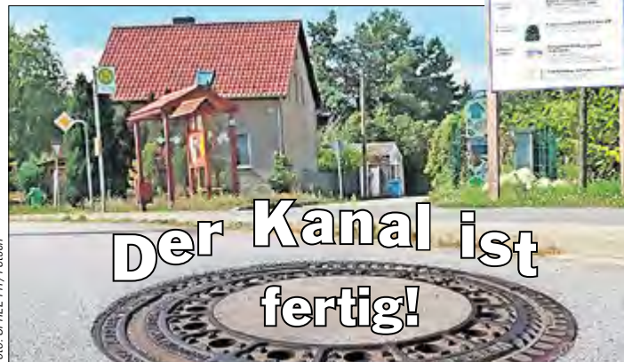
Löwendorf (hier die Wilhelmstraße) ist jetzt am Schmutzwasserkanal.

Ein Ort findet Anschluss! So über-schrieb die MWZ in der Herbstausgabe 2015 ihren Beitrag über Löwendorf. In diesen Tagen zieht eine offizielle Abnahme den Schlussstrich unter die beachtliche Investition des Wasserver- und Abwasser-sorgungszweckverbandes (WARL) im Trebbiner Ortsteil.