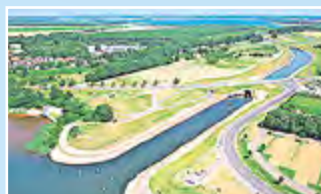
Kanäle verbinden die Seen.

Oder doch lieber eine lustige Seefahrt? Bis Ende Oktober schippern die altherwürdige „Santa Barbara“ und der Solarkatamaran „Aqua Phönix“ noch übern See – vorbei an der einstigen 200 ha großen Tagebau-Innenkippe, die mittlerweile zu einem Brut- und Rastparadies für viele Vogelarten und Naturschutzgebiet geworden ist. Mit dem umweltfreundlichen Katamaran geht's in den 1.050 m langen Koschener Kanal. Ein Abenteuer, wie er mit jeweils einer Handbreit Wasser rechts und links durch die künstliche Wasserstraße zwischen Senftenberger und Geierswalder See schwebt und dabei eine Schleuse und zwei Tunnel (unter der B 96 und der Schwarzen Elster hindurch) passiert. Bis 2020 sollen alle zehn Seen im Brandenburger Teil des Lausitzer Seenlandes miteinander verbunden und so eine Schiffsreise von Senftenberg bis Großräschen möglich sein.