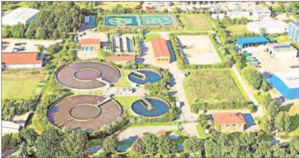
Kläranlagen wie diese in Ludwigsfelde gehören zu den „Energiefressern“ einer Kommune. Hier schlummert aber auch großes Potenzial für Energieeinsparungen.

Mit diesem gemeinsamen Ziel vor Augen haben die beiden Nachbarverbände verschiedene Projekte im Rahmen der Nationalen Klimaschutzinitiative der Bundesregierung angestoßen. Dabei geht es zunächst um sogenannte Klimaschutzteilkonzepte. Das sind individuelle Instrumente für die Betrachtung von Energieeinspar- und -rückgewinnungspotenzialen, deren Summe erst das zusammenhängende Klimaschutzkonzept einer Kommune oder Region ergibt. „Die Betriebe der öffentlichen Daseinsvorsorge verstehen zunehmend, dass sie als kommunale Betriebe Teil der Kommune sind und entsprechend zu deren umfassenden Klimaschutzmaßnahmen beitragen müssen“, hebt Aethner hervor. Der MAVV lässt derzeit beispielsweise die Prozesse seiner Kläranlagen Alt-Schadow und Friedersdorf im Rah-