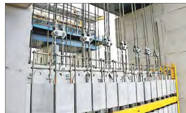
Der Trog ist an 224 Seilen aufgehängt. Diese sind mit 220 Gegengewichten verbunden, welche die Wanne im Gleichgewicht halten. Deshalb kann das neue Schiffshebewerk (wie schon sein Vorgänger) mit minimaler Antriebskraft arbeiten und muss lediglich Reibung, Anfahrwiderstände, Massenträgheit und geringe Wasserspiegeldifferenzen überwinden.