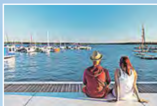
Im Senftenberger Stadthafen.

Im Herbst locken die Perle des Lausitzer Seenlandes zu einer geruhsamen Radpartie und der Pilzreichtum in die Wälder ringsum. Wem es fürs Picknicken zu kalt ist – in etlichen Lokalitäten gibt's Leckeres für den kleinen und den großen Hunger.