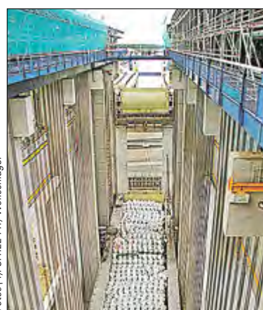
Im beweglichen Trog (unten) schwimmen die Schiffe, während sie gehoben oder gesenkt werden. Er ist gut doppelt so lang und in etwa so breit wie ein olympisches Schwimmbecken.