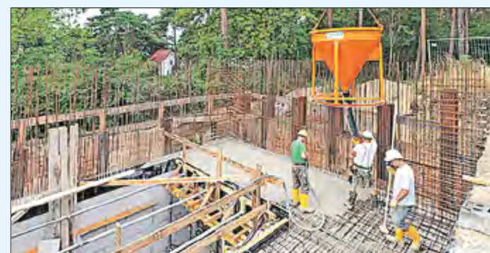
Die Zwischendecke des Bedienhauses wird mit Beton gegossen. Das Wasserwerk Rangsdorf versorgt etwa 13.500 Menschen in Rangsdorf und Dahlewitz mit dem Lebensmittel Nr. 1.