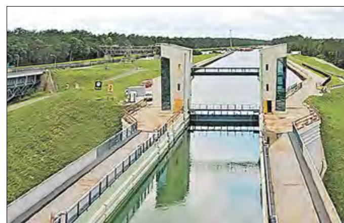
Die 65,50 m lange Kanalbrücke verbindet das Schiffshebewerk mit dem oberen Vorhafen. Sie bietet wie der Hebewerkstrog eine nutzbare Wasserspiegelbreite von 12,50 m. Das Sicherheitstor bildet das östliche Ende der Scheitelhaltung des Oder-Havel-Kanals. Rechts und links erhält die Brücke Seitenwege, die befahren werden können.