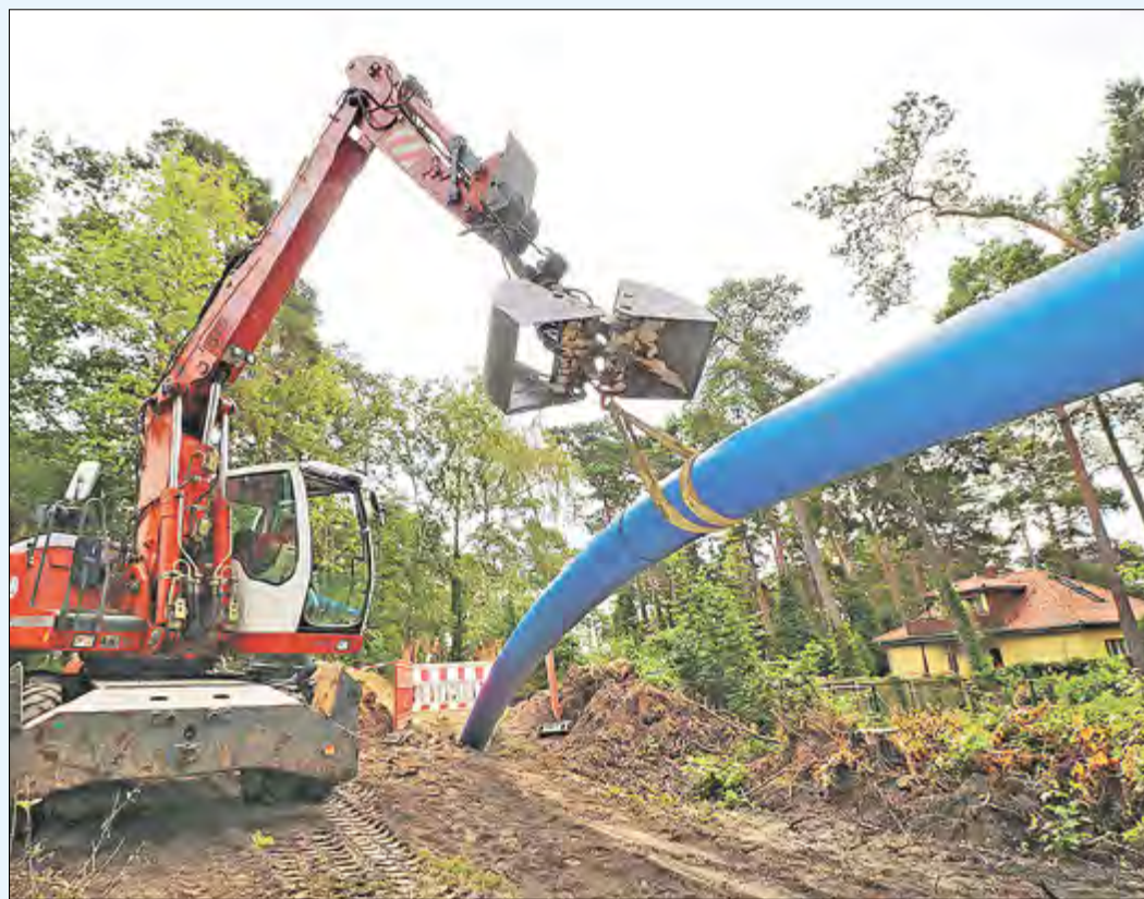
Die neue Wasserwerksausgangsleitung wird mithilfe eines Baggers Zentimeter um Zentimeter „eingezogen“.

Neuer Hochbehälter des Rangsdorfer Wasserwerks kurz vor Fertigstellung