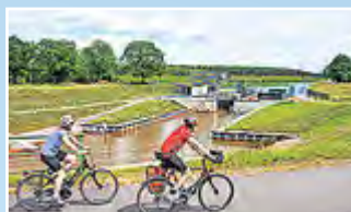
Auf dem Drahtesel um den See – ein Erlebnis für alle Sinne.