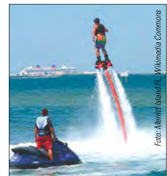
FLYBOARDEN Sprünge bis zu 9m – nicht mal Fliegen ist schöner.

Das Wakeboarden entstand in den 1980ern als eine Mischung aus Wasserski und Wellenreiten. Wenn den Surfern das Warten auf die nächste Welle zu lang wurde, hängten sie sich einfach an ein Motorboot. Das Ziehen übernehmen heute häufig Seilbahnen, sogenannte Cables, die auf einigen Seen zu finden sind. Ein Motorboot oder Jetski zieht einen Wakeboarder mit 35 bis 39 km/h, Seilbahnen schaffen es auf immerhin 28 bis 32 km/h. Ein Verzeichnis mit den schönsten Anlagen finden Sie im Infokasten rechts.