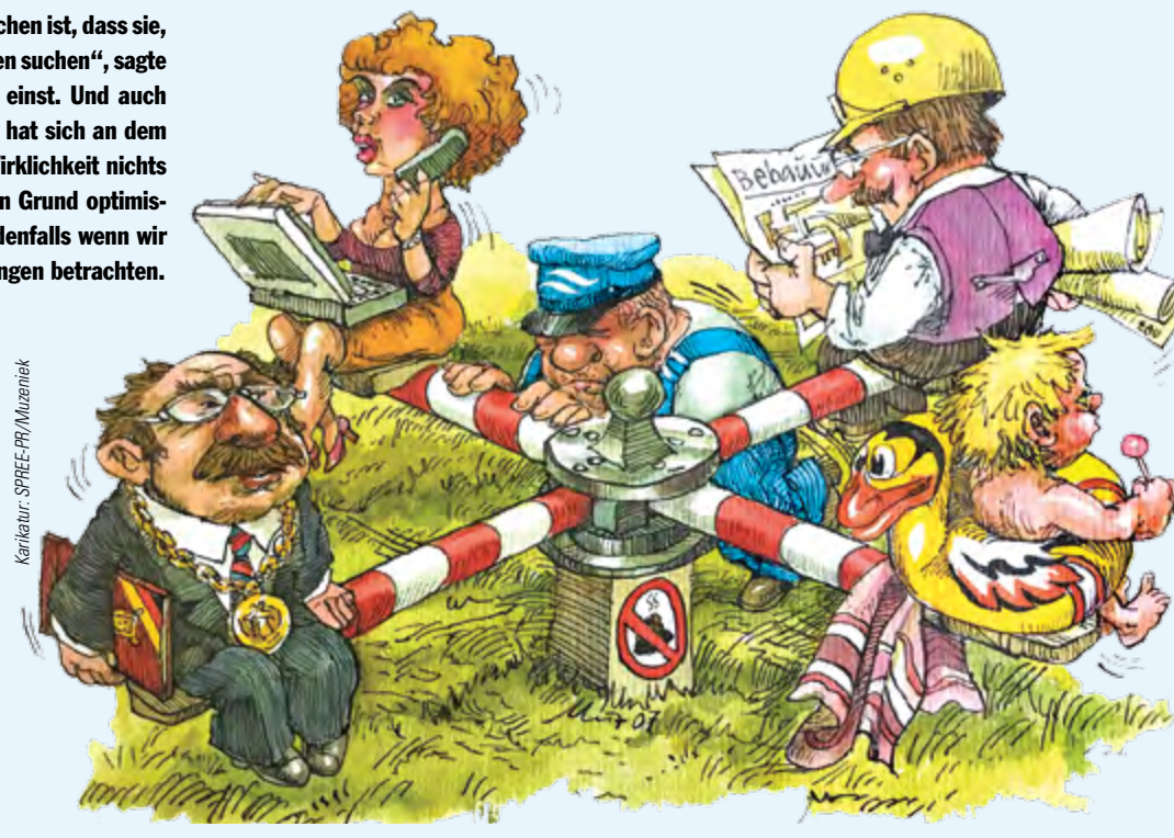
Die Wasserwirtschaft als Anschieber: Sie hält den regionalen Wirtschaftskreislauf im ganzen Land in Schwung.

„Ein eigentümlicher Fehler der Deutschen ist, dass sie, was vor ihren Füßen liegt, in den Wolken suchen“, sagte der Philosoph Arthur Schopenhauer einst. Und auch knapp 170 Jahre nach diesem Satz hat sich an dem eher pessimistischen Blick auf die Wirklichkeit nichts geändert. Dabei haben wir doch allen Grund optimistisch in die Zukunft zu schauen – jedenfalls wenn wir die wirtschaftlichen Rahmenbedingungen betrachten.