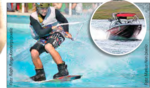
WAKEBOARDEN Ein Mix aus Wasserski und Wellenreiten. Geschwindigkeiten von knapp 40 km/h werden erreicht.