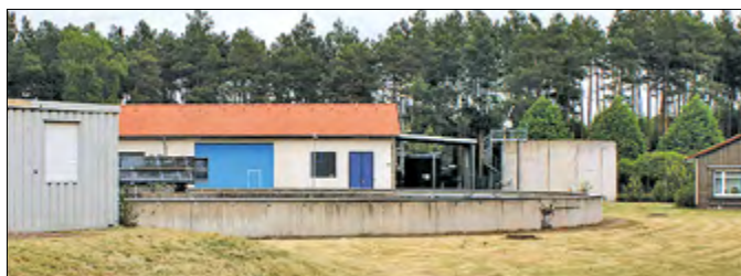
MAWW und DNWAB freuen sich auf Ihren Besuch!