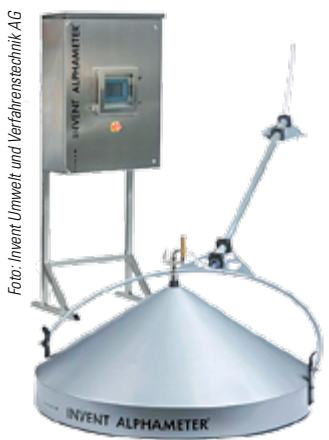
▲ Mit dem ALPHAMETER® lassen sich wichtige Parameter für Prozess- und Belüftungssteuerung beim Klärprozess messen, überwachen und optimieren.

▲ Mit HyperClassic® evolution 7 stellte die Erlanger INVENT Umwelt- und Verfahrenstechnik AG eine revolutionär verbesserte Version ihres Hyperboloid-Rührwerks vor. Der neuartige „Abwasserquirl“ entstand in Zusammenarbeit mit der Uni Erlangen-Nürnberg. Er hat acht langgezogene Rippen, kann mittig und kurz über dem Belebungsbeckenboden eingebaut werden und spart dank mechanischem Belüftungssystem die Hälfte der benötigten Luftmenge! Das macht ihn noch billiger und energieeffizienter als die bisherigen Rührwerke.