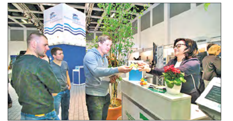
Der Karrieretag gehörte zu den Highlights der Messe. Viele Jugendliche informierten sich auch auf der „Brandenburger Allee“.