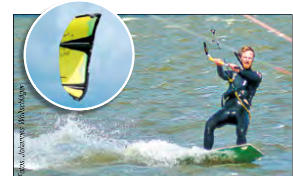
KITESURFING Auf der Suche nach der nächsten Böe – weltweit betreibt eine halbe Million Menschen diesen Sport.