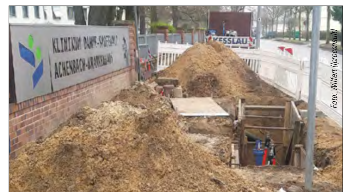
Auch das Achenbach-Krankenhaus in der Köpenicker Straße in Königs Wusterhausen profitiert von der neuen Trinkwasserader.

Direkt vor der Haustür des MAWV in Königs Wusterhausen gab es bis Anfang Juni eine Baustelle, die im Alltag durch blaue Röhren besonders ins Auge fiel. In der Köpenicker Straße, Weg am Krankenhaus und Alte Plantage liegen auf rund 900 Metern neue Trinkwasserleitungen mit Durchmessern von 80 bis 150 Millimeter, die im Horizontal-Spülbohrverfahren verlegt wurden. Die grabenlose Bauweise reduzierte die Erdarbeiten auf das Notwendige. Die Kunststoffrohre (PE-HD) sind ober-tägig zusammengeschweißt worden, ehe sie die alte unterirdische Infrastruktur ersetzen, deren Leitungen aus Stahl und Gusseisen noch aus der Zeit des Baus des Krankenhauses in den 20er Jahren des vergangenen Jahrhunderts stammten. Nach einem öffentlichen Vergabeverfahren wurde die Kesslau GmbH mit Sitz in Frankfurt (Oder) beauftragt.